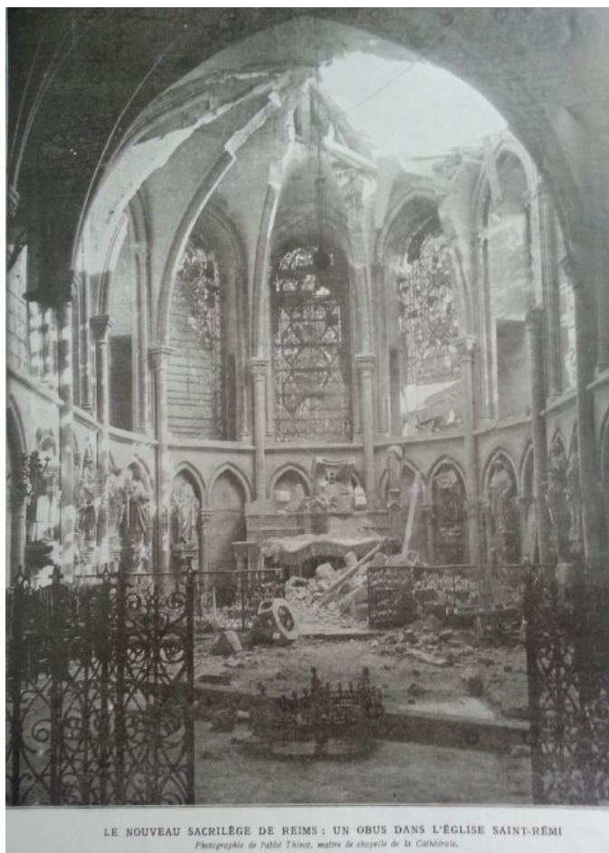
Figure 2 : récupéré sur le site d'Alain Moyat : https://reims1418.wordpress.com/2014/11/18/17-novembre-1914-un-obus-atteint-la-chapelle-de-la-vierge/

3 heures 1/2 ; Les obus de cette nuit ont causé des dégâts effroyables... mais, la grosse misère, c'est St. Remi, frappé un peu avant minuit ; un gros obus est tombé en plein sur une des chapelles rayonnantes de l'abside, celle du fond, plus profonde que les autres, qui est dédiée à la S.S. Vierge. Le projectile a crevé le toit, la voûte, abattu la clef de voûte. La belle statue de Notre Dame de l'Usine et de l'atelier a été projetée sur le pavé... elle n'a rien... un doigt seulement de l'Enfant Jésus a été brisé... mais c'est un amas de pierres, de plâtras indescriptible. Et le trou est immense.